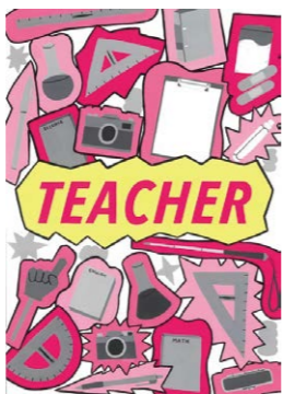
香川デザイン協会賞