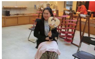
特命全権大使 フォンサムット・アンラワン 閣下