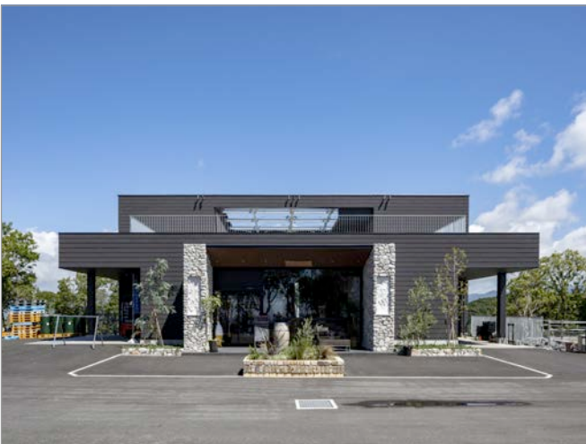
井上ワイナリーのいち醸造所