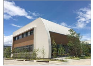
あゆみシューズ直営店