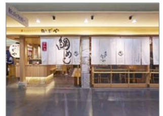
鯛めしかどや 松山空港店