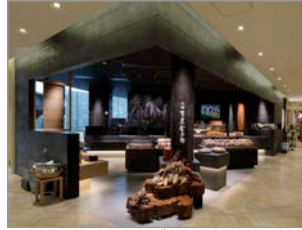
芋屋金次郎グランフロント大阪店