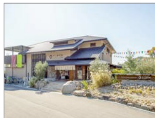
井上誠耕園らしく本館