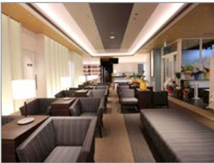
丸亀町クリニック