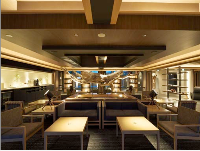
ザ・チェルシー プレス