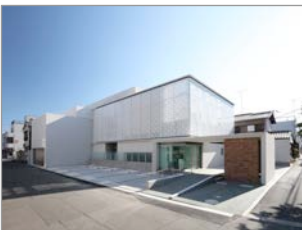
かわさきレディースクリニック