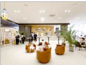
讃岐おもちゃ美術館