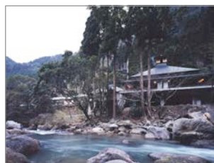
妙見石原荘 天降殿