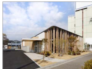
丸亀整形外科とだにクリニック