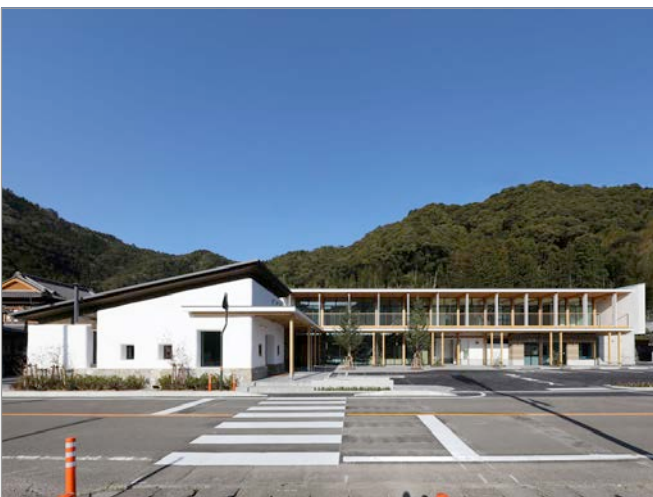
道の駅 よつて西土佐