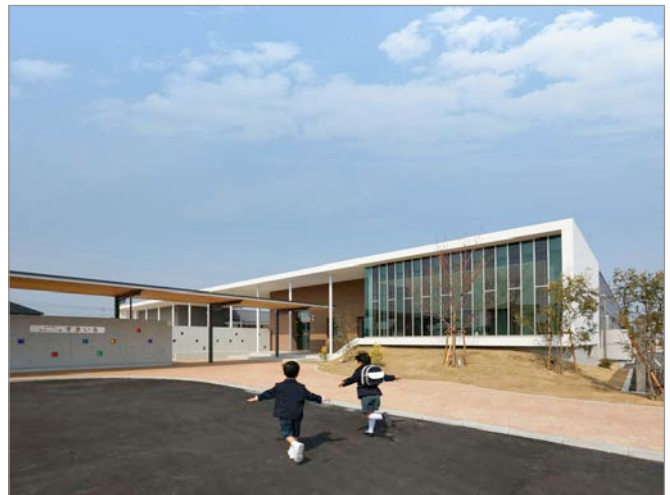
認定こども園 すまいる