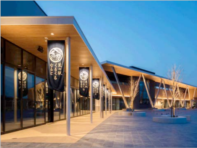
道の駅 くるくるなると