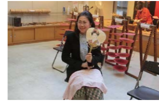
特命全権大使 フォンサムット・アンラワン 閣下