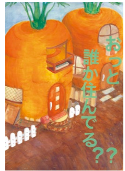
香川デザイン協会賞