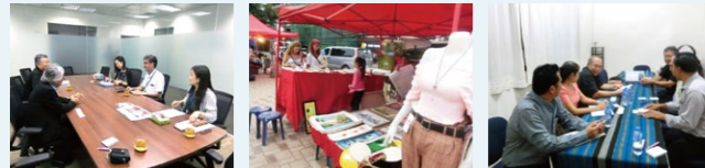
JICA ラオス事務所にて ナイトマーケットでのうちわ販売は継続されている ラオスハンドクラフト協会事務所にて