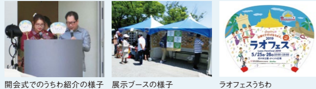
開会式でのうちわ紹介の様子 展示ブースの様子 ラオフェスうちわ