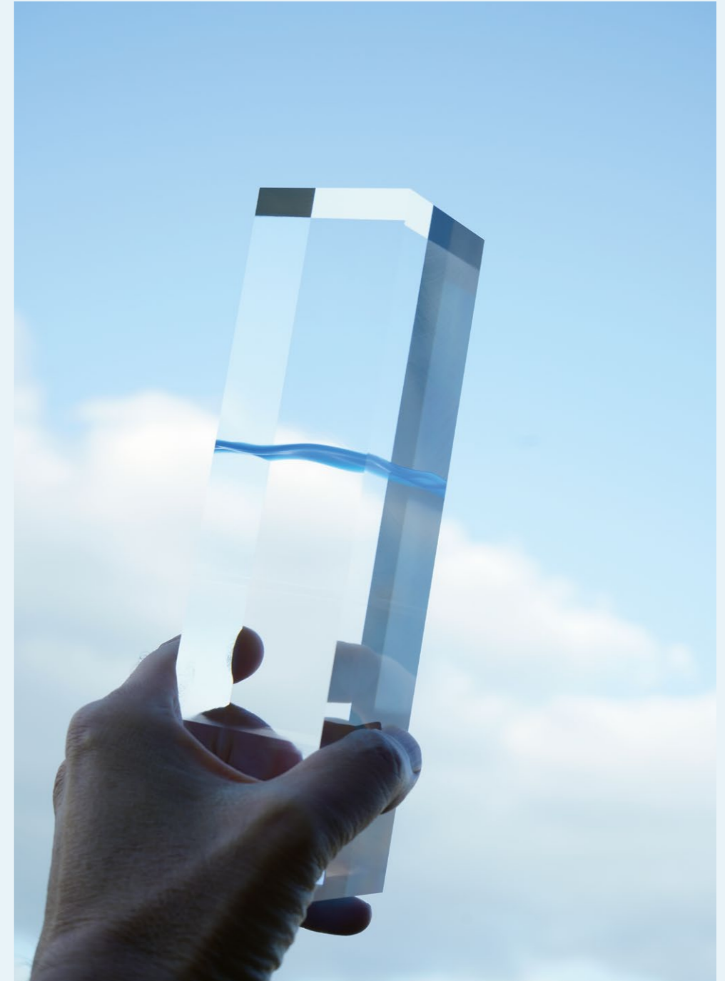
[平成]瀬戸内デザインアワード2019 トロフィーデザイン:井藤隆志(香川大学創造工学部教授) 製作:日プラ株式会社