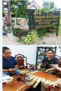
マニラマーケットでの現地調査