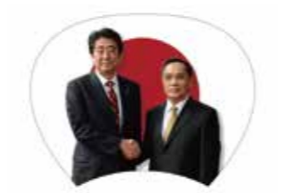
安倍首相とトンシン首相のうちわ