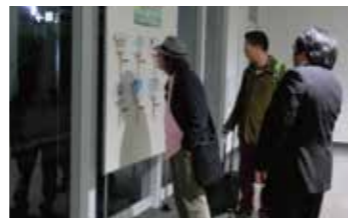
高松空港国際線出発ロビー