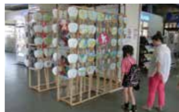
JR丸亀駅コンコース