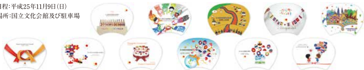
専門学校穴吹デザインカレッジのグラフィックデザイン学科2年生(2013年度)が日ASEAN友好協力40周年をテーマにデザインした「うちわ」