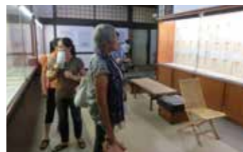
栗林公園商工奨励館