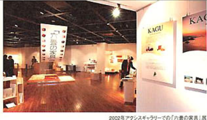
2002年アックスギャラリーでの「六畳の家具」展

会場 ●「アックスギャラリー (AXIS GALLERY)」 東京都港区六本木5-17-1 Tel.03-3587-2781 www.axisinc.co.jp 主催 ●香川県家具商工業協同組合 協賛 ●香川県デザイン協会 後援 ●香川県・ジェトロ香川 問合せ ●香川県デザイン協会 事務局 Tel.087-869-3700