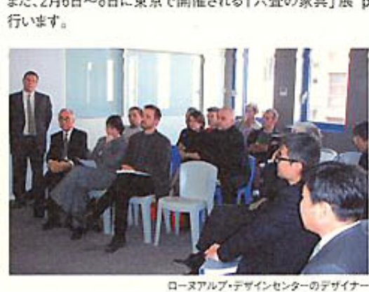
ローヌアルプ・デザインセンターのデザイナー

フランス・ローヌアルプ地方との家具デザイン交流事業の一環として、2月初旬にデザイナー(5名)と専門家(2名)が来県し、県内の家具工場、漆器工場の見学や(有)JLSが製作したフランス・デザイナーによる家具のチェックなどを行う予定です。また、2月6日～8日に東京で開催される「六畳の家具」展 part-2の視察も行います。