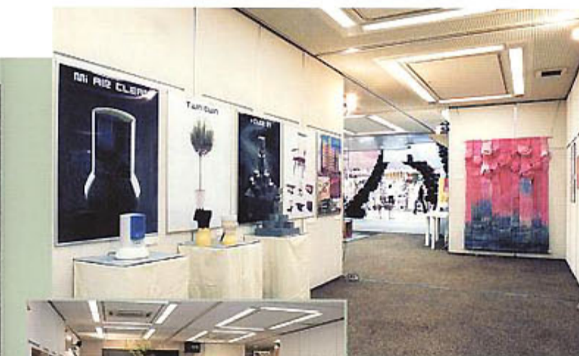
丸亀町レッツ1F会場