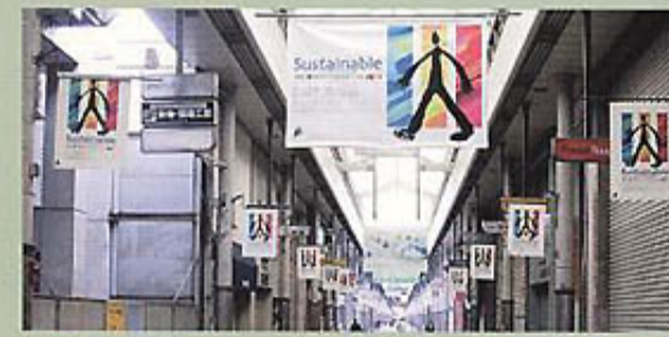
丸亀町商店街アーケードの大型バナーポスター