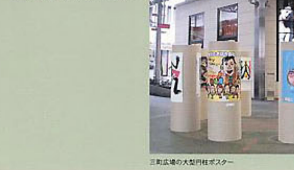
三軒広場の大型柱バナーポスター