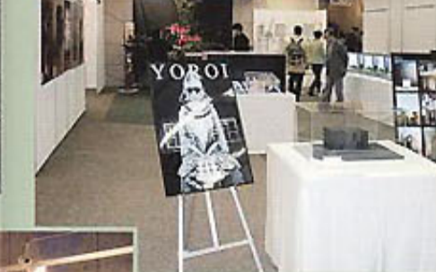
丸亀町レッツ2F会場