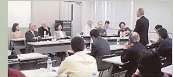
意見交換会の模様

平成13年度からジェトロ・県を中心になって取り組んでいるフランス・ロースアルプ地方と香川県の家具・デザイン産業の交流事業(ミニLL事業)の一環で、3月17日～23日の1週間、フランス家具産業組合副理事、ロースアルプ産業デザイン振興協会のデザイナー等6人が来県し、県内の家具メーカー、住宅等の視察を行ったほか、セミナーや当協会のデザイナー・家具組合のメンバーとの意見交換会を行うなど、活発な交流が行われました。平成14年度もこの交流を継続し、フランス人デザイナーからの家具デザインの提案や当協会デザイナーとのコラボレーションも予定されています。