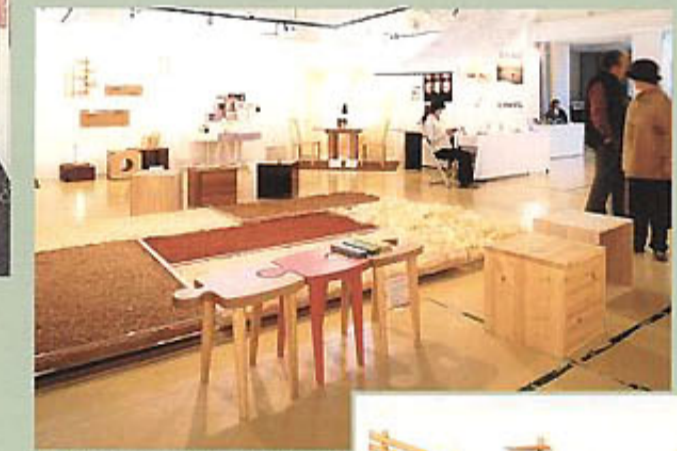
「六畳間の空間」をテーマに、ブランド化推進委員会のメンバーがデザイン開発した「六畳の家具」