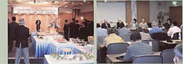
週末に行われた歓迎レセプション