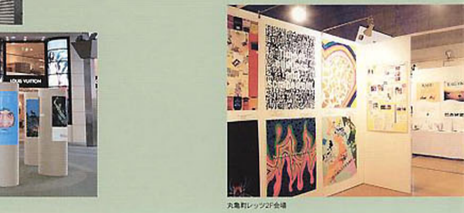
丸亀町レッツ2F会場