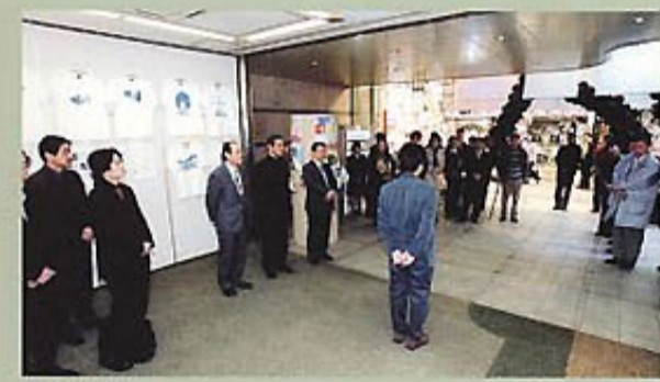
オープニング風景

去る3月14日～21日までの8日間、第4回目の会員作品展となる「香川デザインフェスティバル2002」を昨年に引き続き、高松・丸亀町レッツと丸亀町商店街において開催しました。丸亀町レッツへの来場者数は、8日間で5,585人(1日平均698人)を数え、1日平均来場者数は昨年(648人)を上回り、多くの県民の方々に会員デザイナーの作品を見ていただきました。また、丸亀町レッツ2階では、香川県家具商工業協同組合の委託を受け、ブランド化推進委員会のメンバーがデザイン開発した家具の企画展示「六畳の家具」展を行うなど、協会デザイナーのパワーと実力を示せたのではないかと思います。