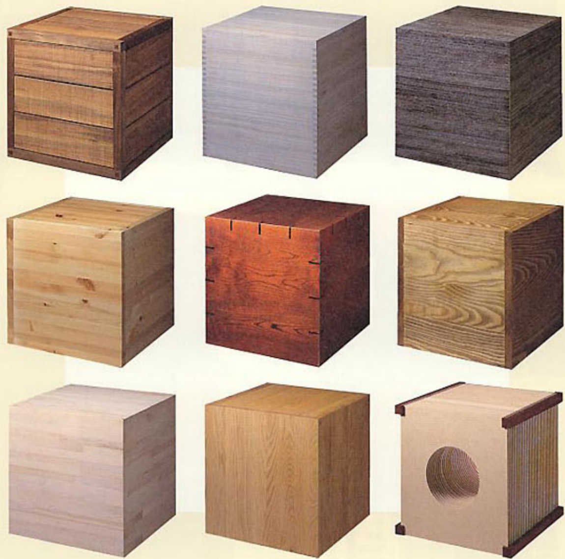
「六畳の家具」展イメージボックス