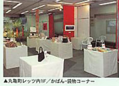
▲丸亀町レッツ内1F/かばん・袋物コーナー