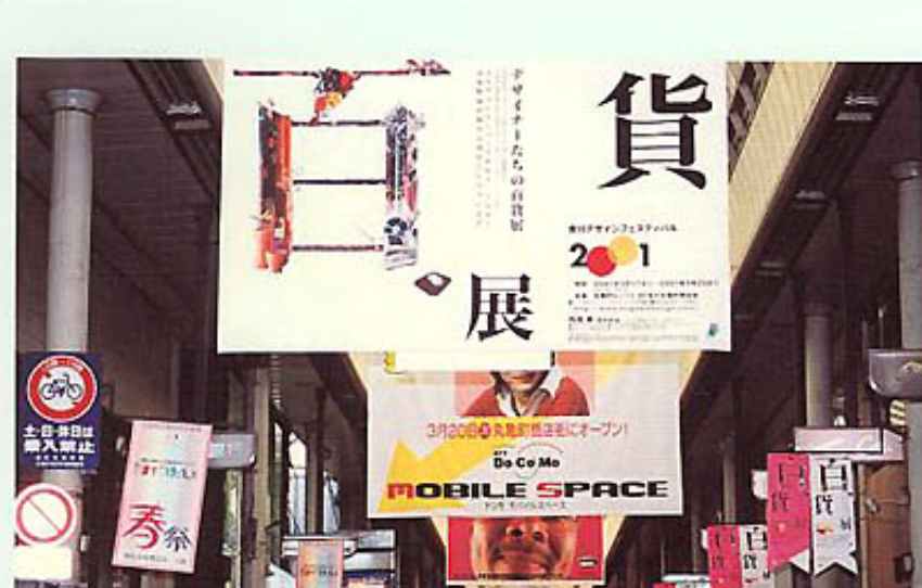
▲丸亀町商店街アーケードを飾った大型バンポスター