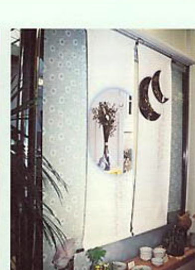
▲丸亀町商店街ディスプレイ展示 (高橋/アートギャラリー転出)