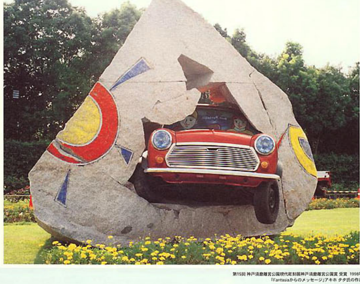
第15回 神戸造形研究公団現代彫刻展神戸造形研究公団賞 受賞 1999年 『Antaresからのメッセージ』アキタ氏の作品