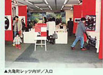
▲丸亀町レッツ内1F/入口