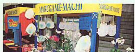
▲丸亀町レッツ前に設置されたストリートワゴン