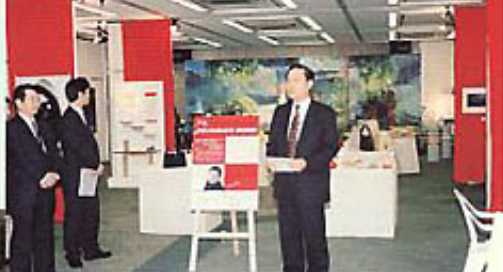
▲オープニング風景

新世紀のスタートを飾る「香川デザインフェスティバル2001~デザイナーたちの百貨展~」が、3月17日(土)から25日(日)までの丸亀町レッツを中心とした高松丸亀町商店街で行われました。より多くの方々にデザインを少しでも身近に感じてもらいたい!というコンセプトのもと商店街を舞台に開催しましたが、今後、デザインが人々の生活に溶け込むとともに、商店街活性化の一助となれば幸いです。