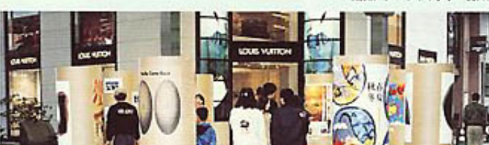
▲三町広場的大型円柱ポスター