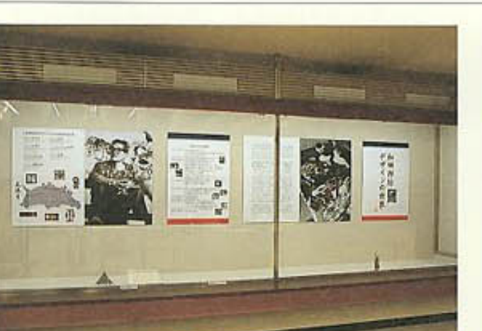
3F特別展示 和田邦坊デザインの世界