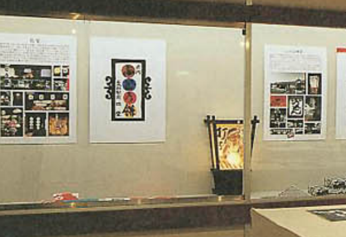
3F特別展示 和田邦坊デザインの世界