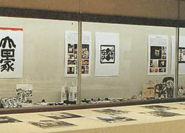
3F特別展示 和田邦坊デザインの世界