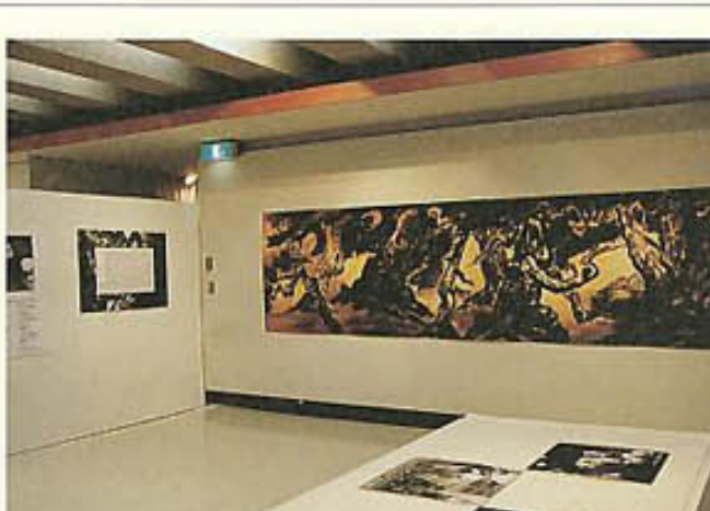
3F特別展示 和田邦坊デザインの世界