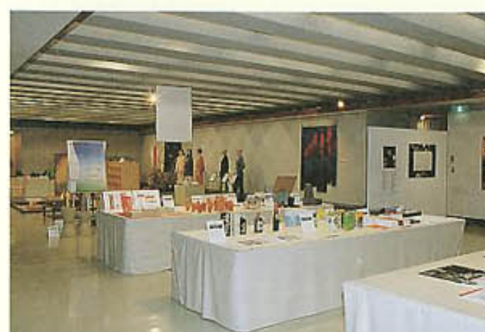
3F自由部門(手前は香川県地場産業デザインルネサンス事業の成果品)