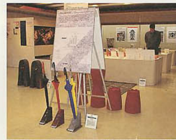
かがわデザインフェスタ2000に展示された香川県地場産業デザインルネサンス事業の成果品